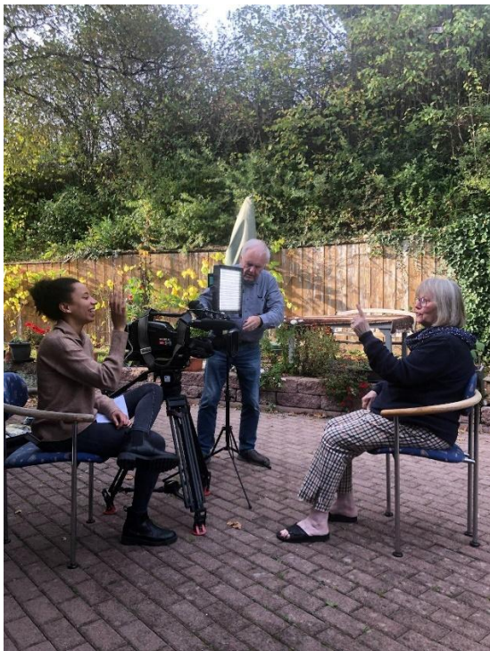
Interview und Fragen zum Preview im SWR

In Absprache mit dem Filmteam und dem SWR wurden Ramstein traumatisierte Opfer eingeladen, die bis heute Schwierigkeiten haben, mit den Folgen der Traumatisierung zu leben. Wir sprachen über den Film und die Möglichkeit sich zu distanzieren, wenn die Ängste auftauchen. Auch das gemeinsame Anschauen half den Betroffenen.